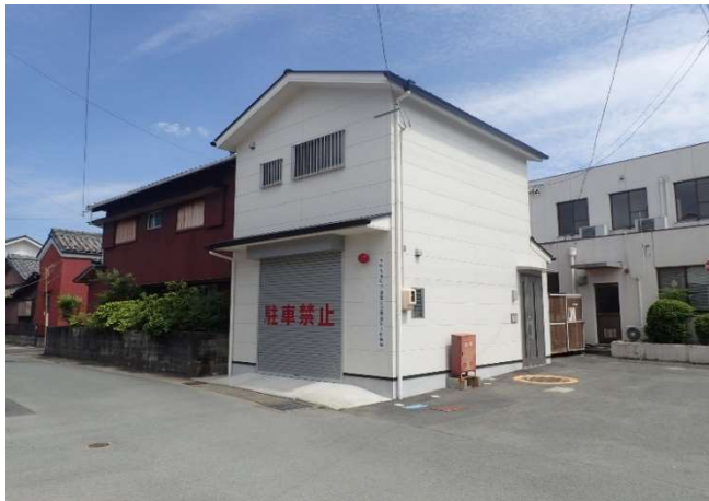
消防団御園分団第3班倉庫